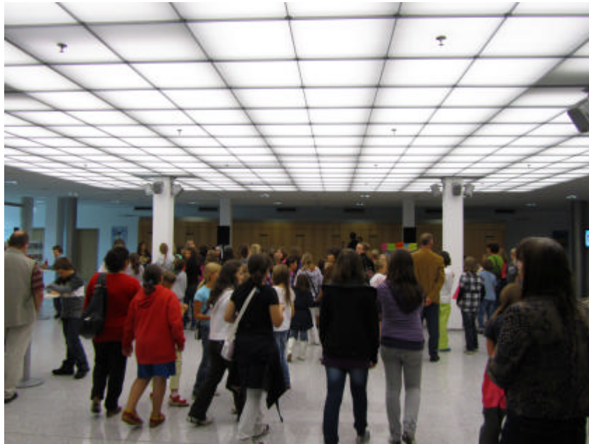
Die Abschlussparty am 03. September 2010...